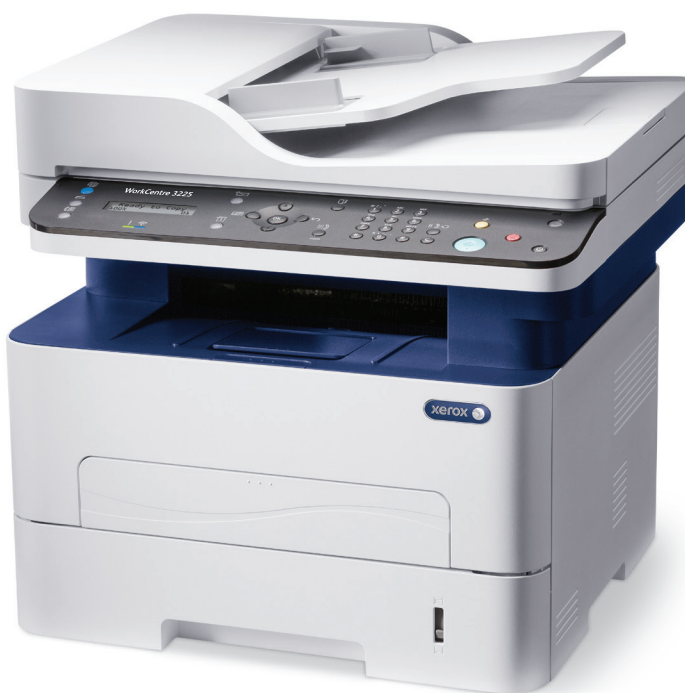
WorkCentre 3225. Copiere. Imprimare. Scanare. Fax. E-mail.