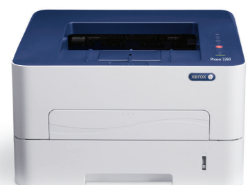
Phaser 3260. Imprimare.